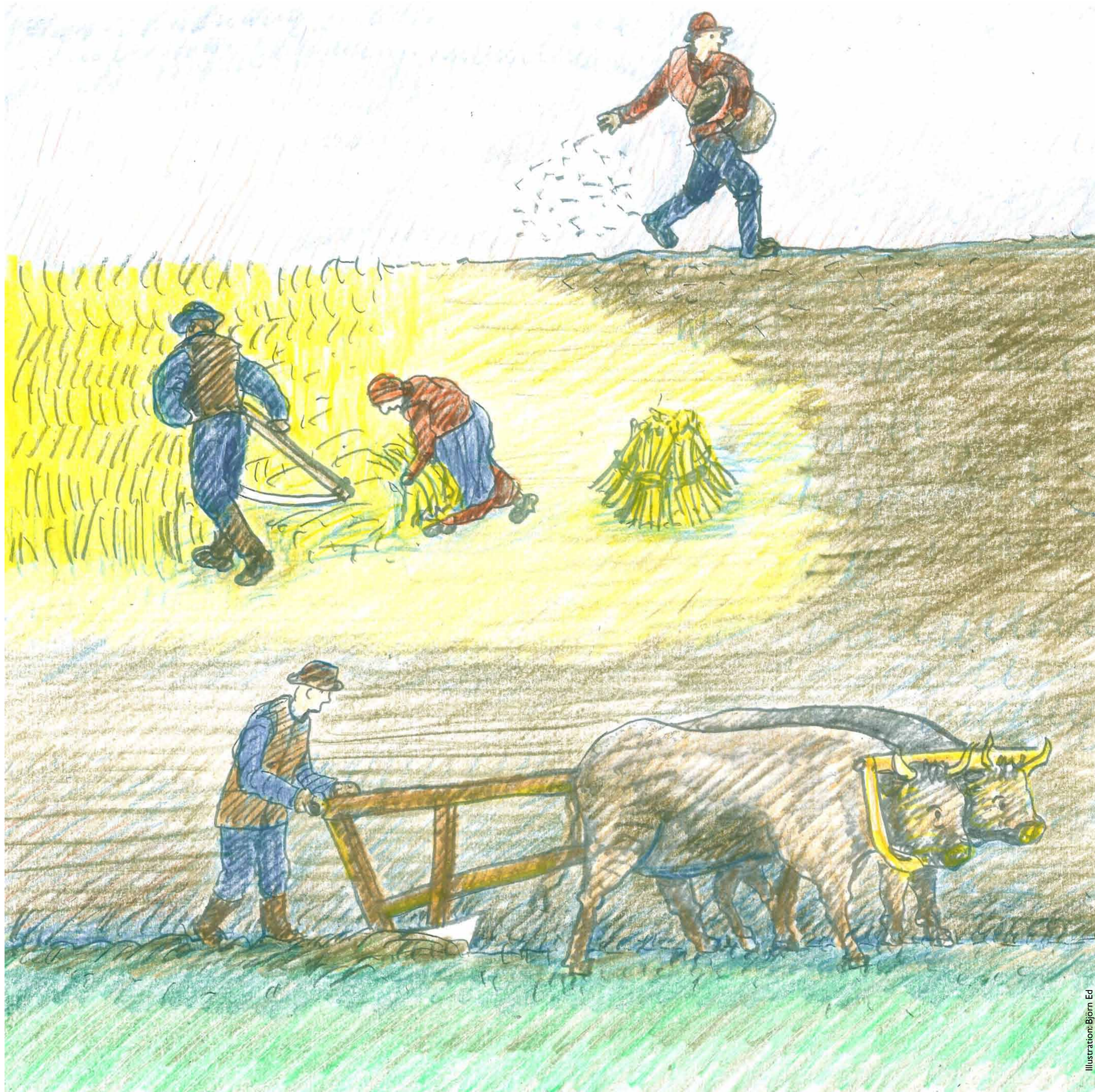
Illustration: Björn Ed