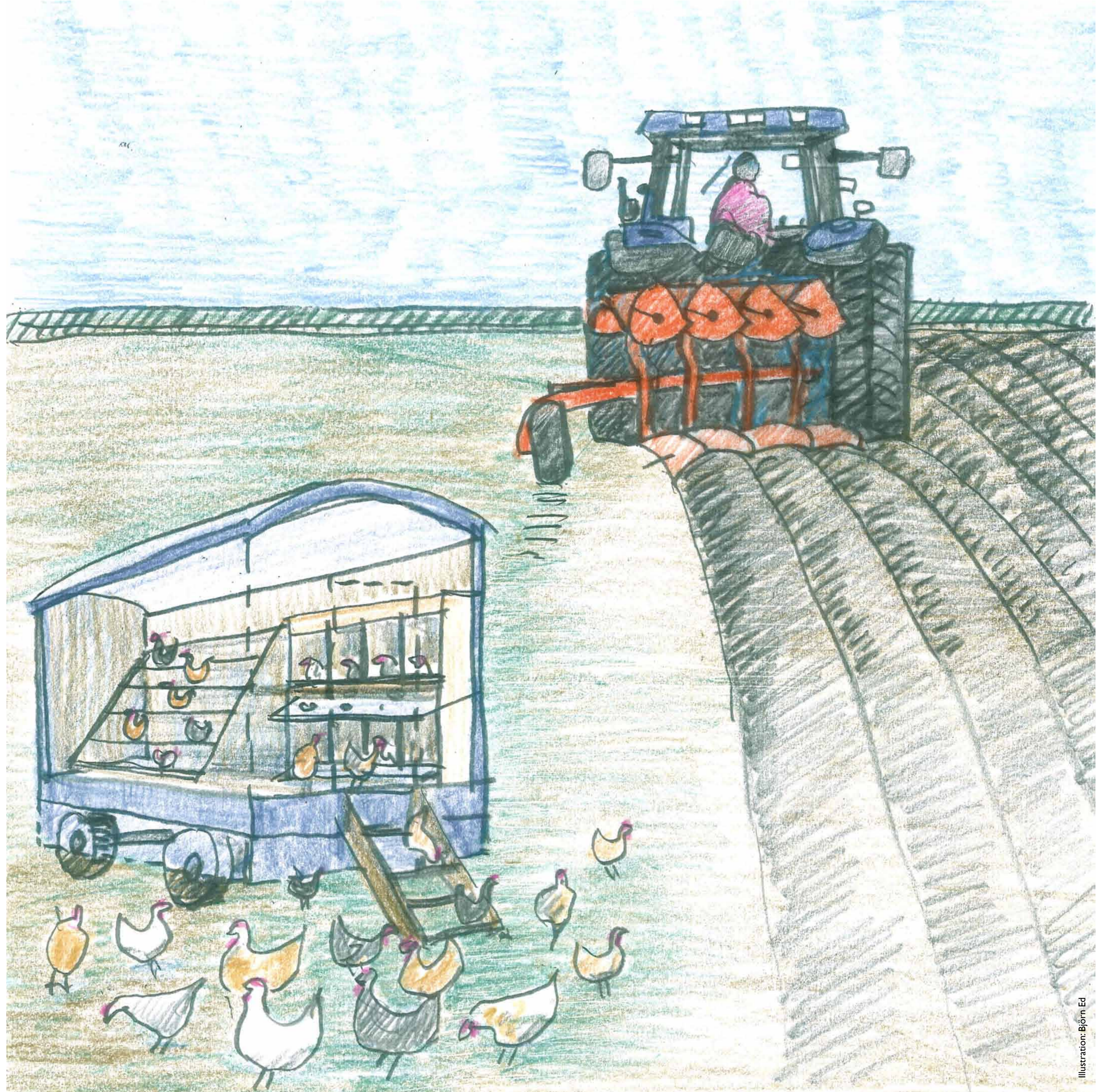
Illustration: Björn Ed