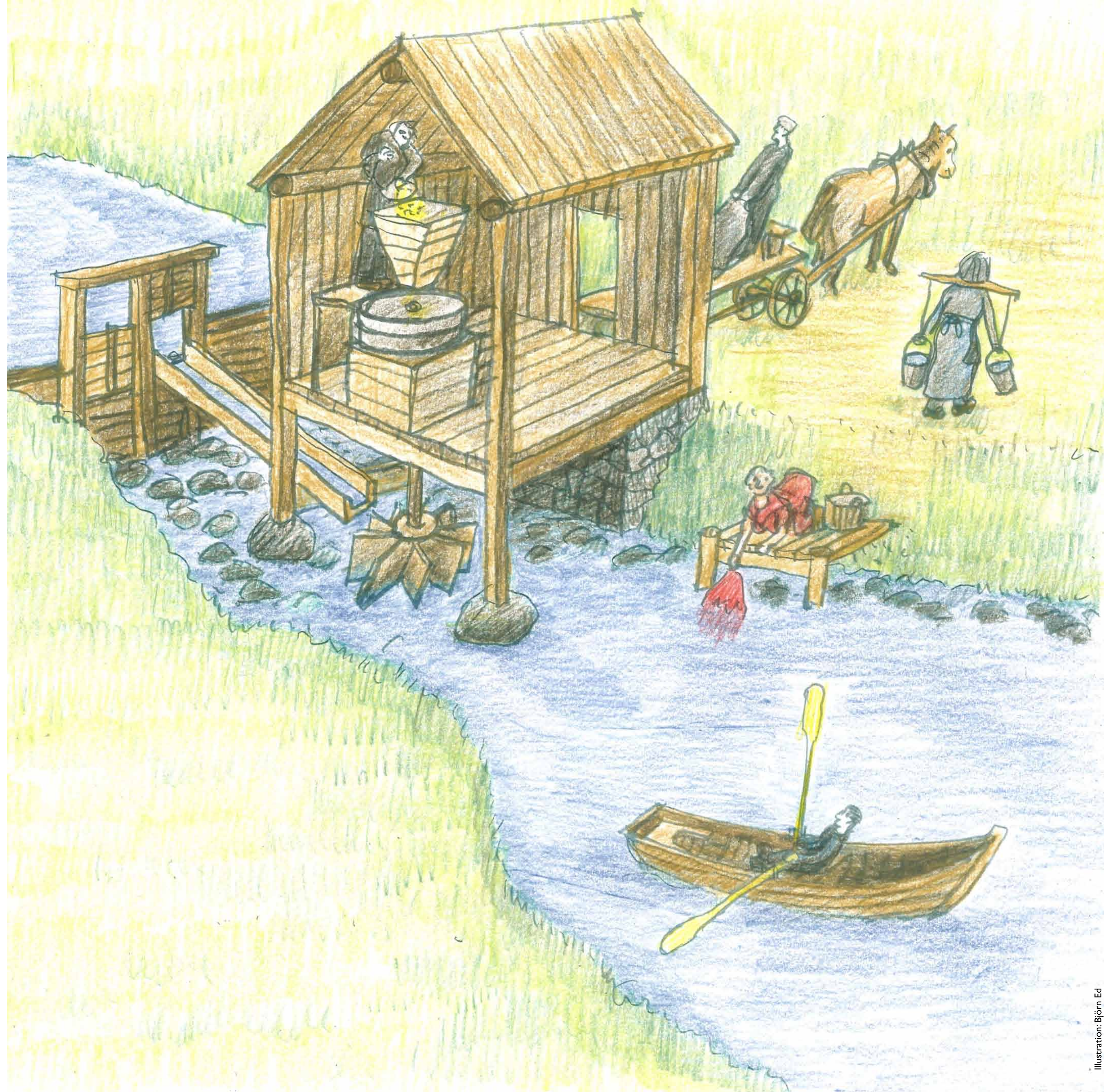
Illustration: Björn Ed

Fisket i Igelbäcken var ett omtyckt tillskott till kosthålllet. Det sägs att kung Fredrik I planterade in fisken grönling i bäcken på 1700-talet. Den ansågs som en läckerhet. Nu är den en raritet som ska skyddas.