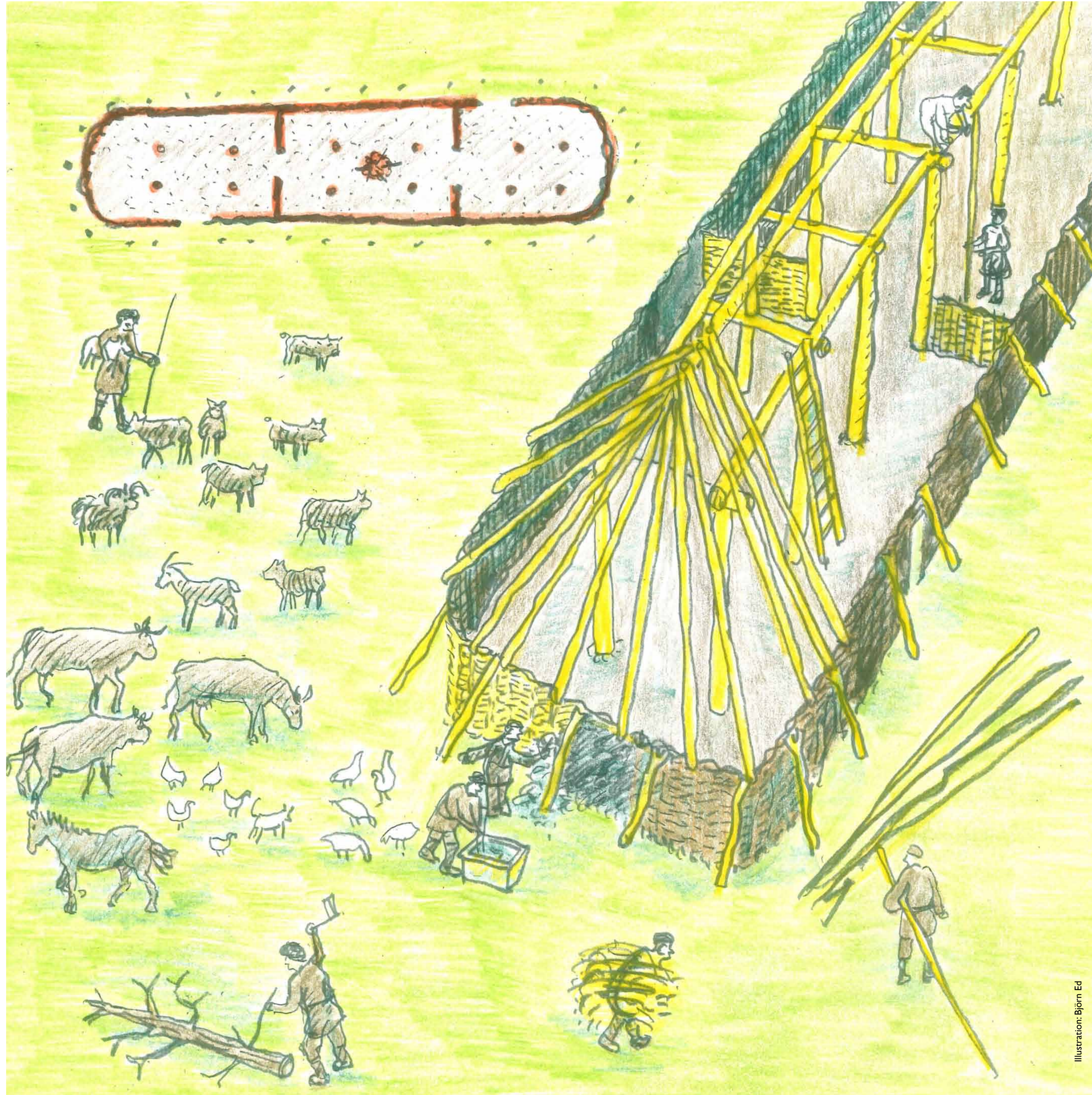
Illustration: Björn Ed